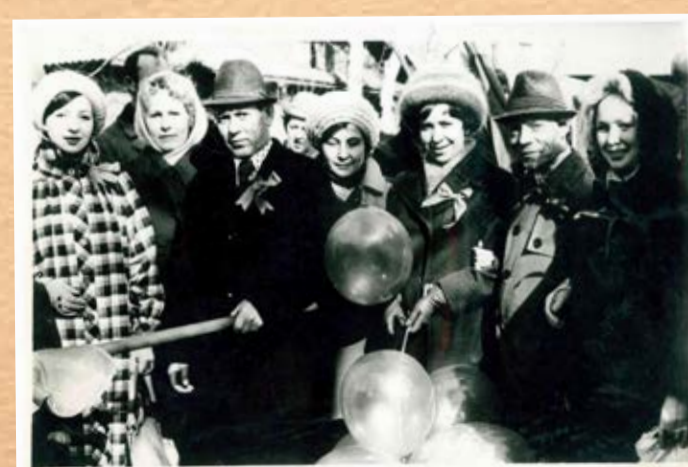
На демонстрации, 70-80 годы