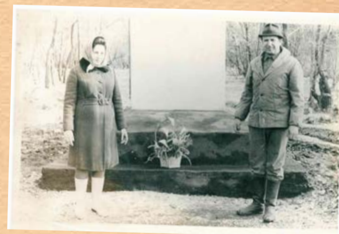
Коммунистический субботник, 70-е годы