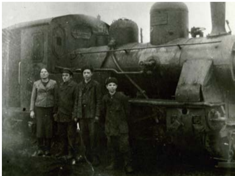
Рабочие ПТУ. 1944 год.