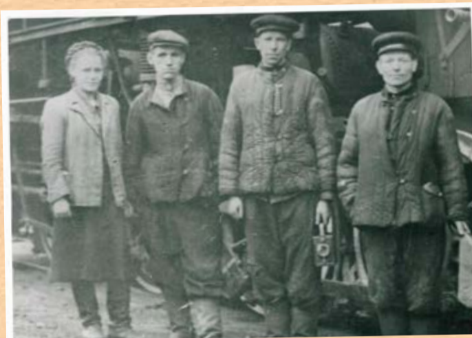
Работники ПТУ, 40-е годы