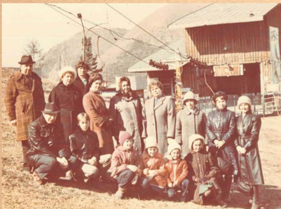
Отдых по путевке выходного дня, 80-е годы