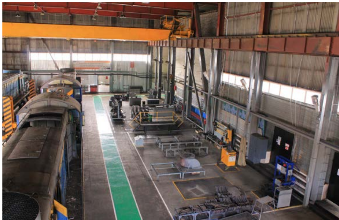
Ремонтный цех нового депо. 2015 г.

в Кемерово и станция реостатных испытаний тепловозов; • в 1990 году – ангар для авто-тракторной техники в Кемерово (сейчас это цех по ремонту экипажной части тепловозов).