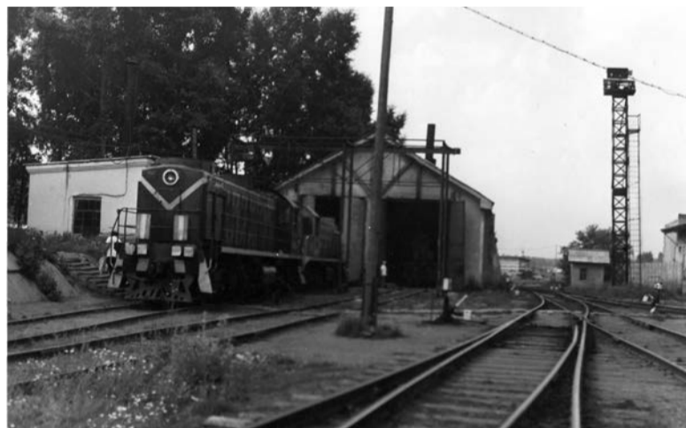
Деревянное паровозное депо. 1984 год.

Периодом расцвета ПТУ стали 70-е и 80-е годы. Жизнь бурлила во всех направлениях. Это период наивысших производственных результатов работы предприятия и участия трудящихся в общественной жизни. Ежегодно выезжали на сенокос, на уборку урожая в совхозы. Организовывали выезды по грибы, прогулки на теплоходе по реке Томь. Проводили спортивные соревнования и шахматные турниры. Коллектив участвовал в работе народной дружины и активно выходил на субботники. Много внимания уделялось детям, начиная с утренников