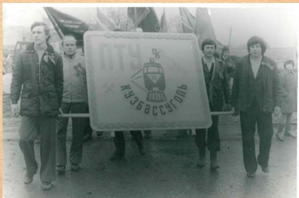
Участники первомайской демонстрации, 80-е годы