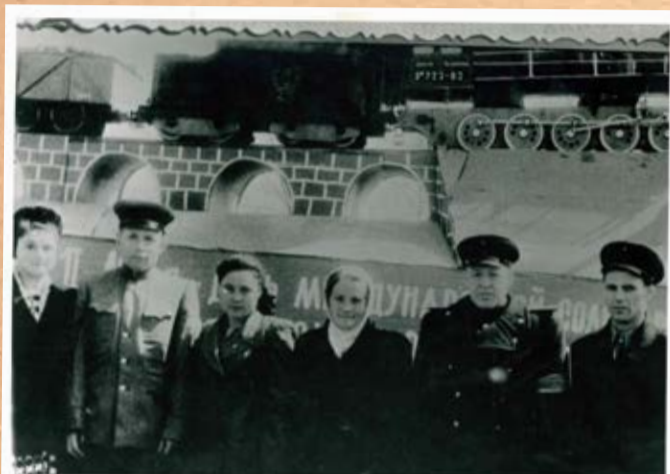
Работники ПТУ, 40-е годы

Советская и российская эстрадная певица, актриса, народная артистка СССР Эдита Станиславовна Пьеха пела: «Чтобы жизнь повторилась сначала, загляните в семейный альбом!». В железнодорожной семье ПТУ пока нет своего альбома, однако есть много снимков, старых и не очень. Хочется верить, что альбому все-таки быть, а пока – вот только малая часть славной истории.