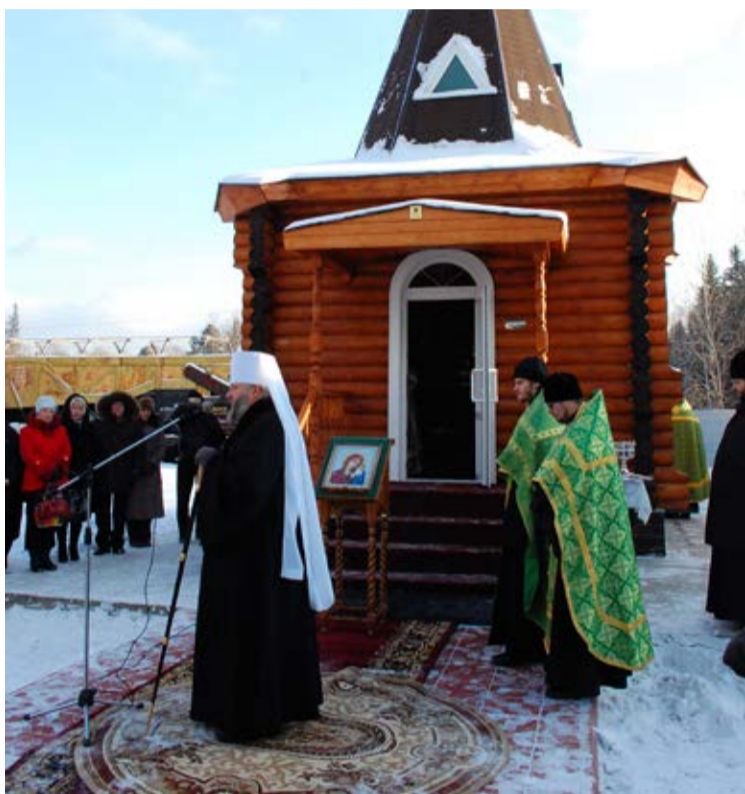
Открытие часовни, 2012 г.

для самых маленьких и заканчивая туристическими поездками в другие города для подростков. Оказывали помощь подшефной школе и даже содержали на балансе свой детский сад.