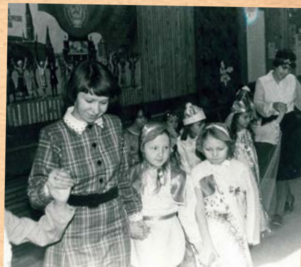
Дети работников ПТУ на Новогоднем утреннике, 80-е годы