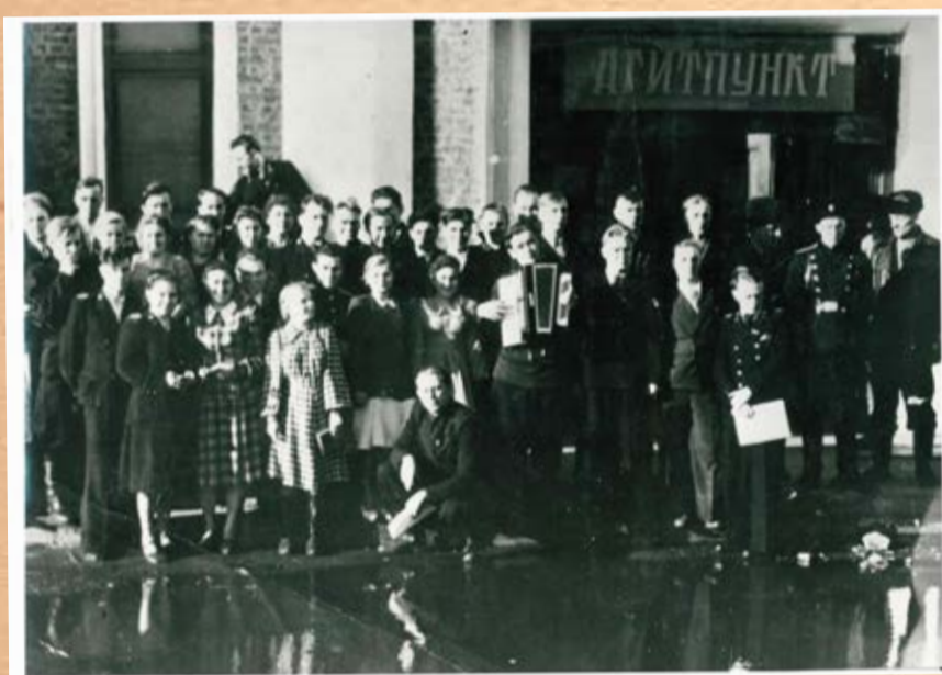
Участники районной комсомольской конференции, 50-е годы