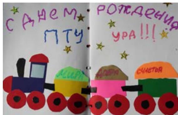
София Щеглова, 4 года