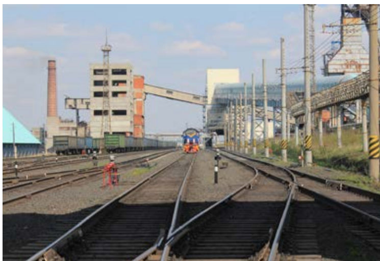
Станция «Берёзовская». 2012 год