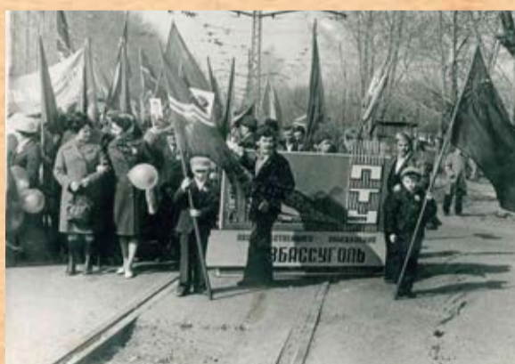
Первомайская демонстрация, 70-е годы