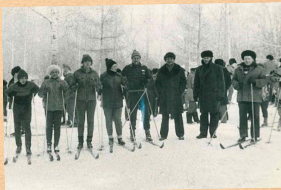
Лыжные соревнования, 80-е годы