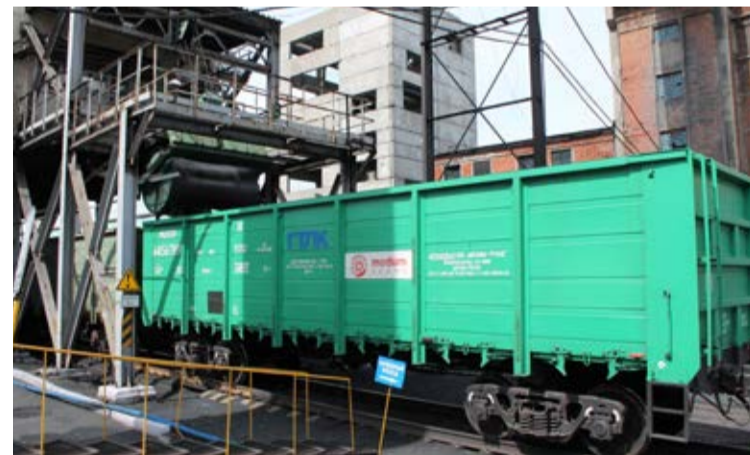
Погрузка «черного золота» – главный вид деятельности ПТУ

Протяженность рельсовой колеи – 44854 м. Объекты ПТУ расположены в г. Кемерово, г. Березовский и Кемеровском районе: 4 станции, 3 железнодорожных перегона и 3 околотка. На вооружении службы пути специализированная техника. Локомотивный парк ПТУ – 13 тепловозов серии ТЭМ2, ТЭМ18ДМ и ТЭМ7А. Локомотивное депо имеет 8 стоек для технического обслуживания и ремонта локомотивов, вплоть до капитального. Среднегодовой грузооборот Погрузочно-транспортного управления за последние 5 лет составил около 65 миллионов тонно-километров.