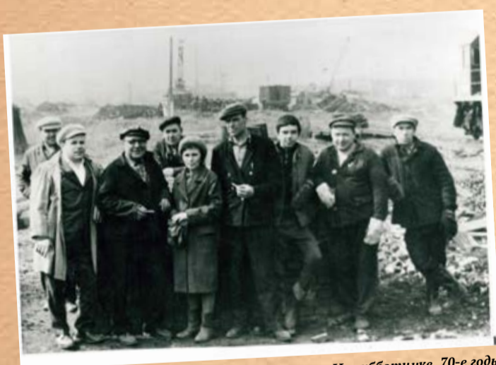
На субботнике, 70-е годы