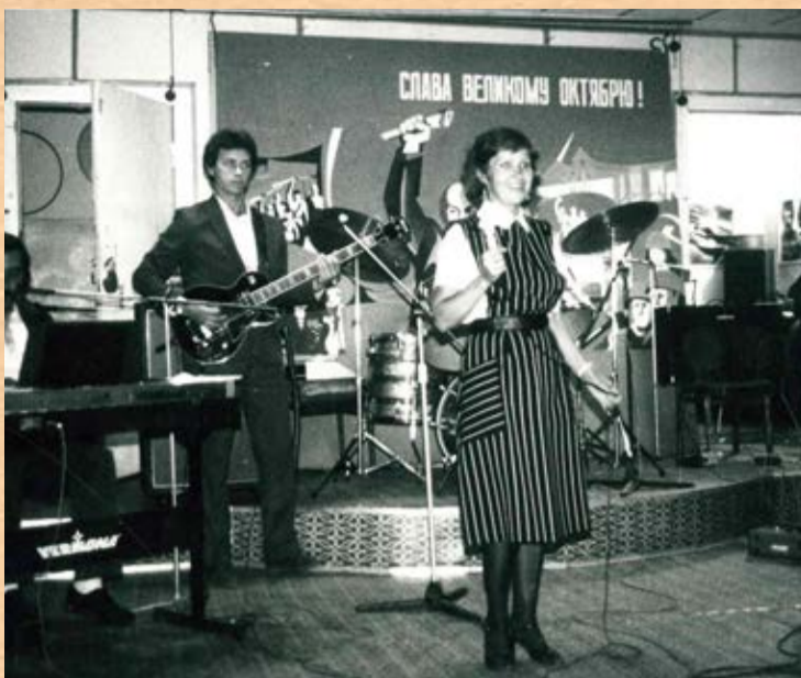
Вокально-инструментальный ансамбль ПТУ, 80-е годы