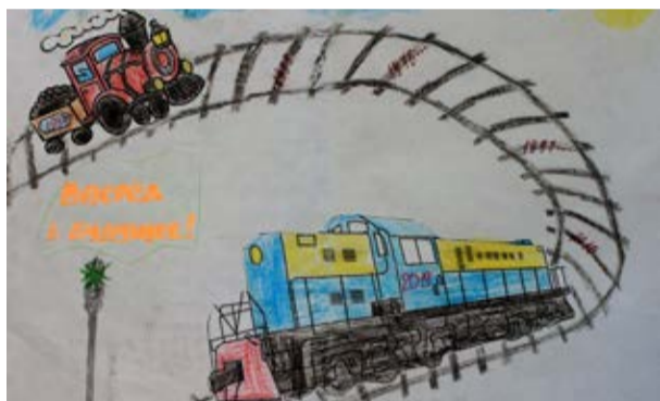
Семен Зайцев, 10 лет