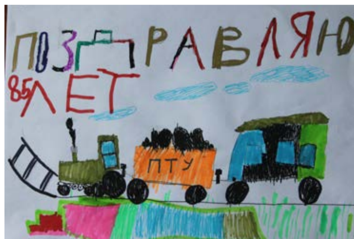
Илья Брус, 6 лет