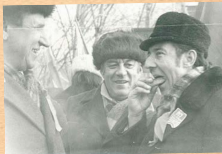
Перед демонстрацией в честь годовщины революции, 70-е годы