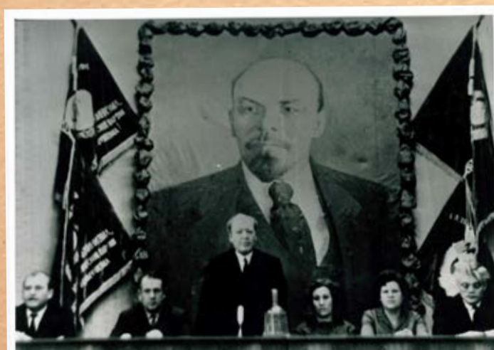
Заседание президиума, 70-е годы