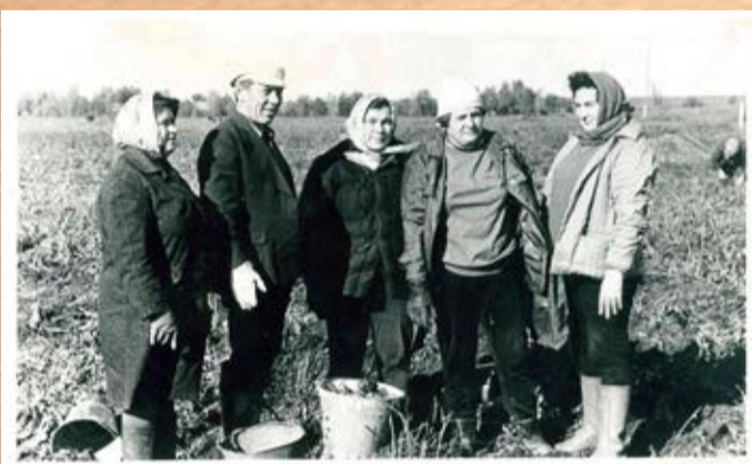
Коллектив ПТУ на копке картофеля в совхозе Андреевский, 80-е годы