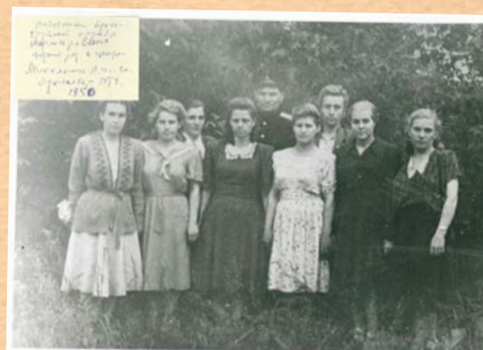
Работники бухгалтерии, 50-е годы