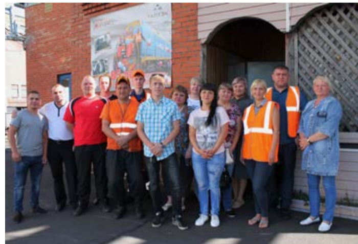
Конкурсанты в номинациях Лучший дежурный по станции и Лучший составитель поездов