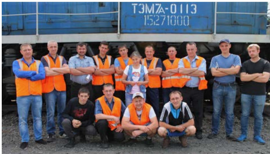
Жюри и участники конкурса на звание лучшего машиниста и его помощника. В их числе и представленные к юбилейным наградам